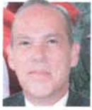
Dip. Genaro Carreño Muro