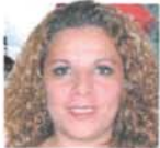
Dip. Rocío Adriana Abreu Artiñano